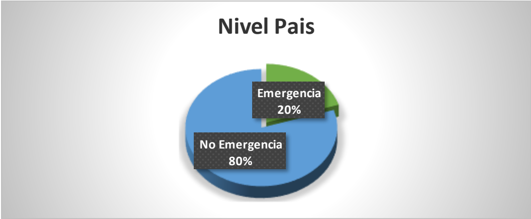
Gráfico N° 1. Porcentaje de Llamadas de Emergencia y No Emergencia: